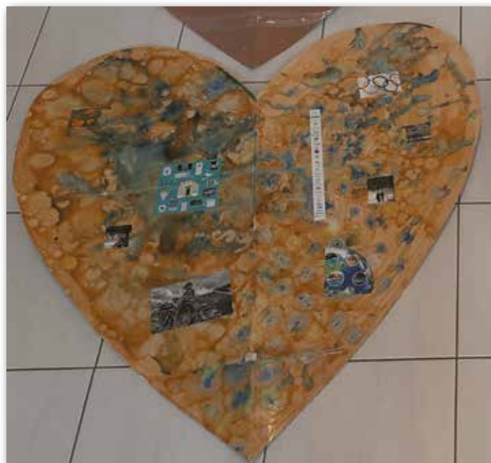
celorepubliková výtvarná soutěž - 3 místo