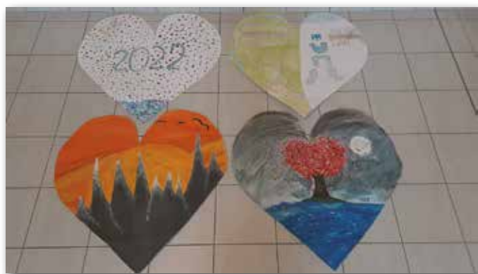
celorepubliková výtvarná soutěž