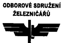
ŽELEZNIČNÍ STANICE BRNO HLAVNÍ NÁDRAŽÍ