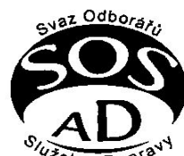
Služeb a Dopravy